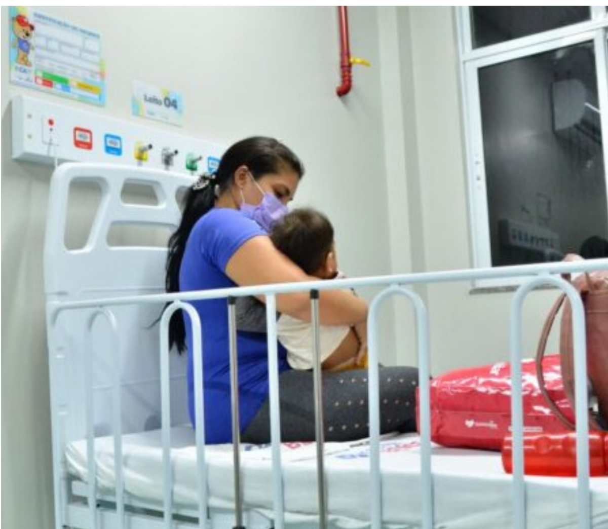
Levantamento foi divulgado pelas unidades de saúde na tarde desta quarta-feira, 31.

O Hospital da Criança e Adolescente (HCA) e o Pronto Atendimento Infantil (PAI) registram 126 internações por Síndrome Respiratória Aguda Grave (SRAG), nesta quarta-feira, 31. Deste total, 93 crianças ocupam leitos clínicos nas enfermarias do HCA e PAI e outras 33 estão em leitos da Unidade de Terapia Intensiva (UTI), com monitoramento de equipe multiprofissional 24 horas.