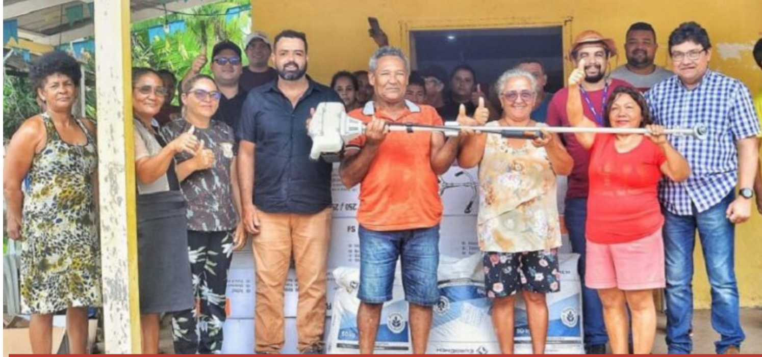
Investimento soma cerca de R$ 1 mi e beneficia 80 famílias produtoras de quatro assentamentos rurais

O cultivo da mandioca é uma das atividades mais tradicionais do Amapá, e que dá origem a diversos outros alimentos que fazem parte do cotidiano local, como a farinha produzida a partir deste tubérculo. Para ampliar e desenvolver a mandiocultura, o Governo do Amapá entregou no fim de semana dez toneladas de insumos agrícolas e 40 roçadeiras para 80 famílias produtoras do mu-